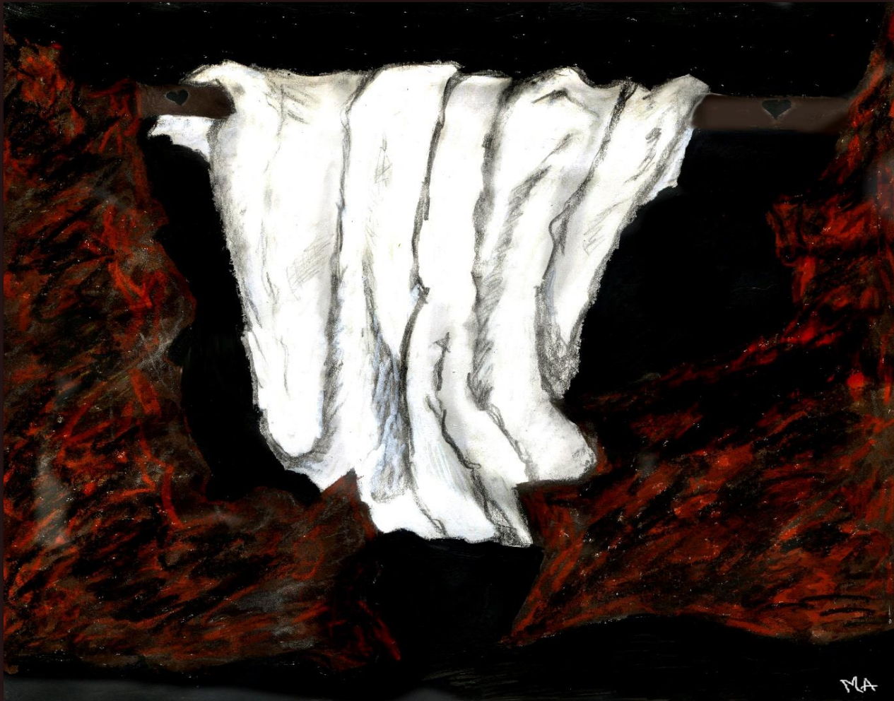
Illustration du livre